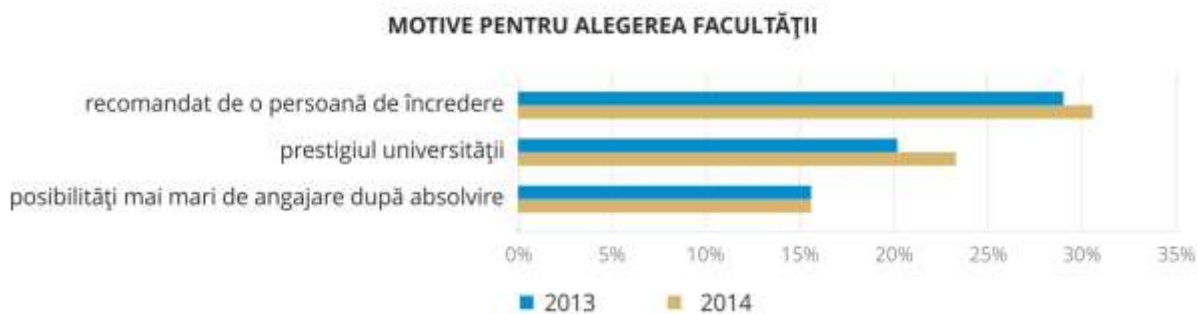
Figura 1 – Principalele motive pentru alegerea facultății/universității

Pe de altă parte, este important de menționat faptul că 77% dintre tineri care au ales, în anul 2014, Universitatea Româno-Americană afirmă că alegerea lor a fost influențată de acordurile pe care universitatea le-a încheiat cu universități de prestigiu din străinătate (Fig. 2), fapt care reliefează unul dintre principalele avantaje oferite, alături de profesionalismul cadrelor didactice, care a fost apreciat de peste 70% dintre studenți și de adecvarea activității didactice la nevoile reale de formare profesională - 72%.